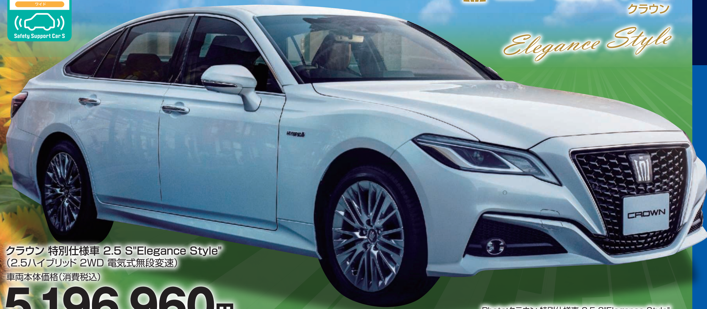
クラウン 特別仕様車 2.5 S"Elegance Style" (2.5ハイブリッド2WD 電気式無段変速)